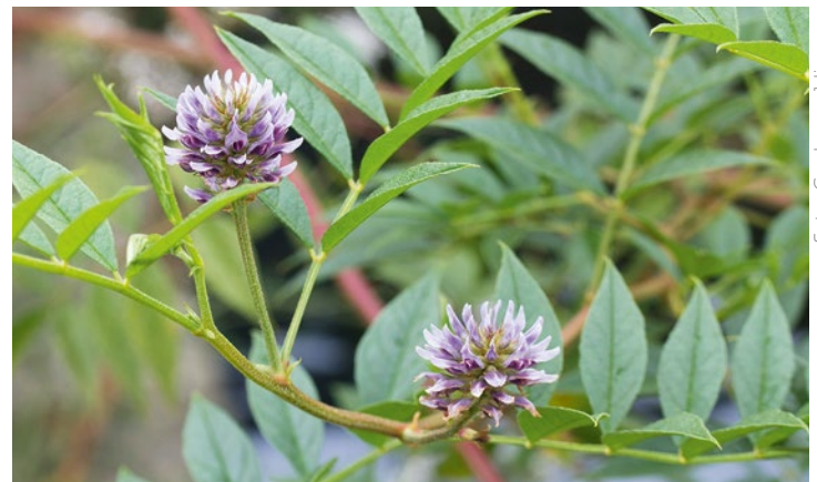
Uiterst boven en boven G. yunnanensis in de zomer en de herfst.